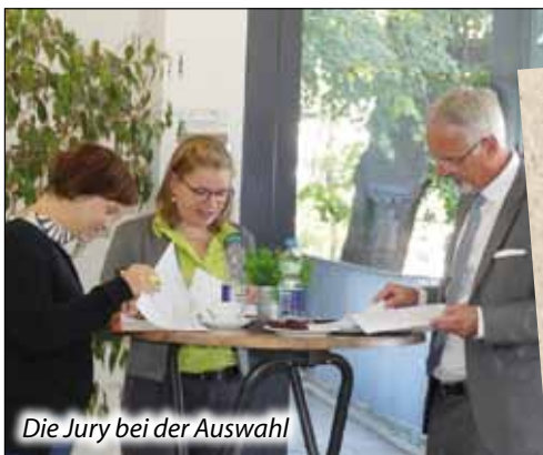
Die Jury bei der Auswahl