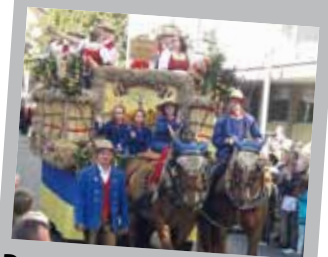
Der Erntewagen der LJ Markgröningen in Bad Cannstatt