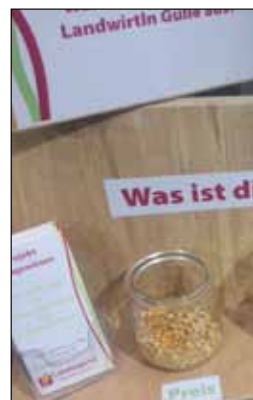
So haben die Besucher...