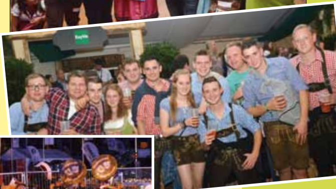
Auf der Party spielte zur Begrüßung der Landjugend Fanfarenzug Ankenreute