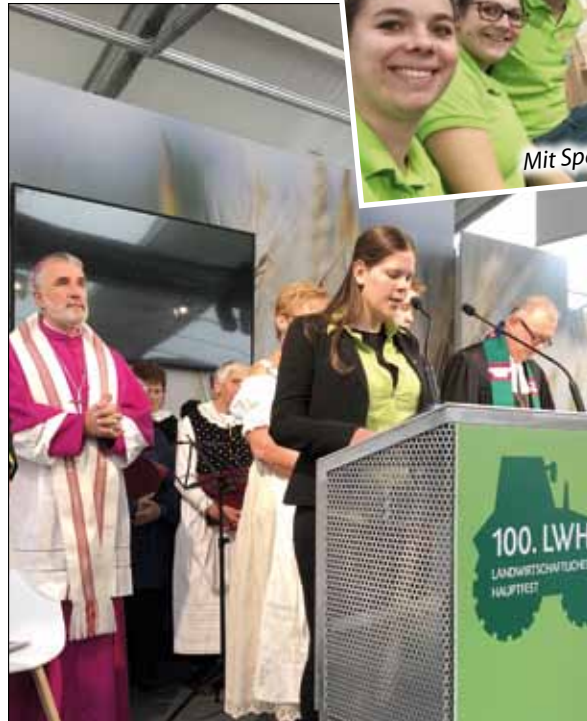
Lesung der Fürbitten