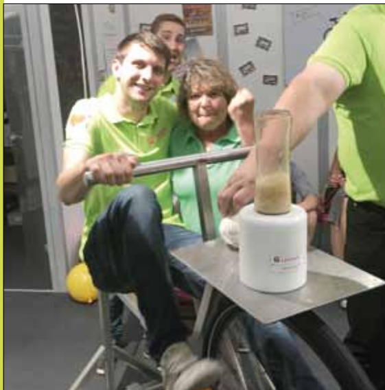
Für Kaba und Zopf wird gerne gestrampelt