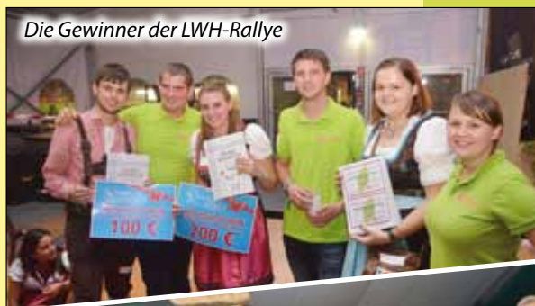
Die Gewinner der LWH-Rallye