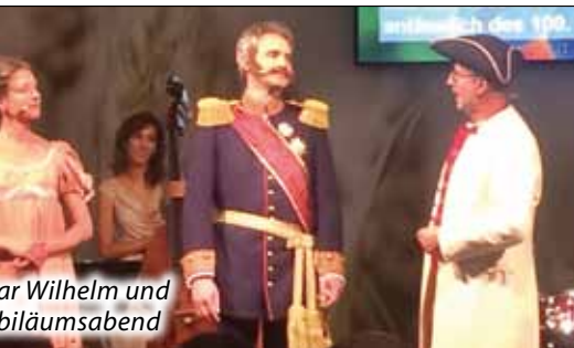
König Wilhelm und die Krönungsfeier