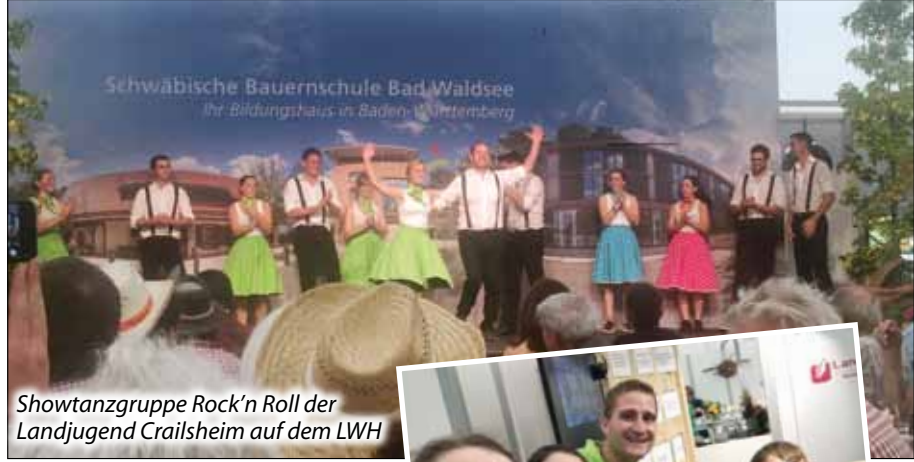
Showtanzgruppe Rock'n Roll der Landjugend Crailsheim auf dem LWH