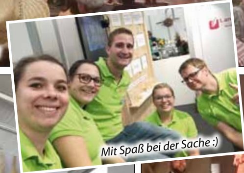
Mit Spaß bei der Sache :)