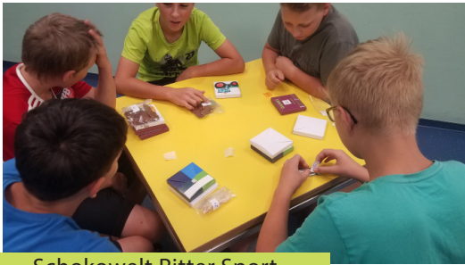
Schokowelt Ritter Sport