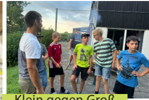
Klein gegen Groß